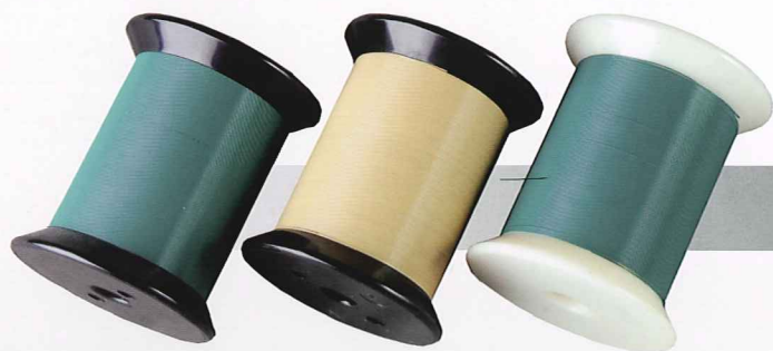
耐高溫有色漆包線 Heat Resistant Magnet Wire